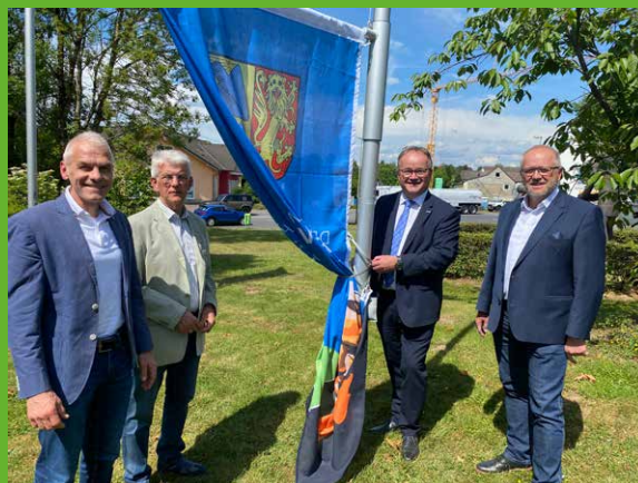
Das Fahnentrio von Weyerbusch, auf dem Gelände des Raiffeisen-Begegnungszentrums