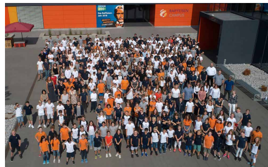
Bildungsbrücken zwischen Münsterland und Westerwald