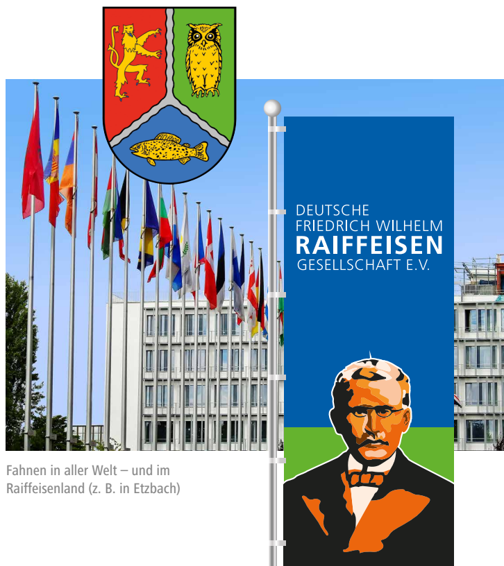
Fahnen in aller Welt – und im Raiffeisenland (z. B. in Etzbach)