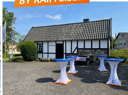
Das Raiffeisen-Begegnungs-Zentrum in Weyerbusch – inkl. Backhaus